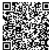
Länge 240 cm